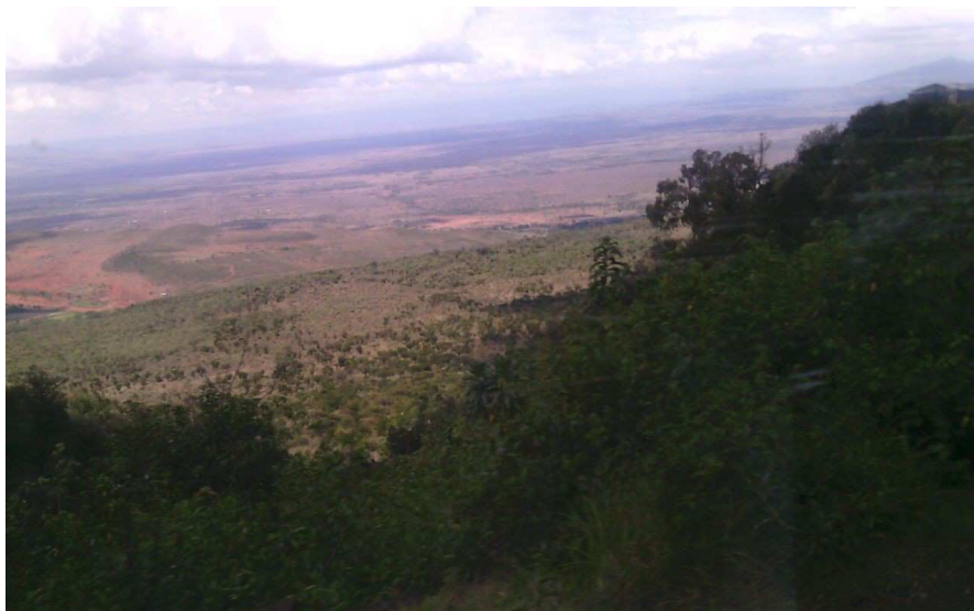
The Rift Valley

De bijenhouderijen hebben een aantal oogsten achter de rug. Echter, op dit moment is er sprake van een reeds langdurige droogte waardoor de bijenkasten geheel leeg zijn komen te staan. Door de droogte is ook al een deel van het vee bezweken. Het goede nieuws is dat het inmiddels wat heeft geregend (deze maand). Nu hopen dat die weersverandering zich doorzet. Zodra de meren weer water hebben en het water weer stroomt, zullen de bijen terugkeren.